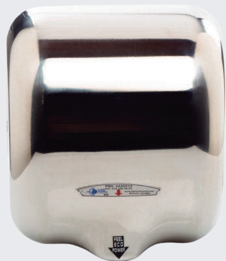
Secador de manos con tiempo de secado turbo / 7 seg.