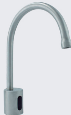
Grifería de sensor cuello de ganso para lavamanos LAV VTR 567

Compuesto por válvula de pedal de pie en aluminio fundido. Grifo cuello de ganso metálico en cromo duro o acero inoxidable. Tubería conexión de 1/2 pulgada y flexo manguera de 3/8.