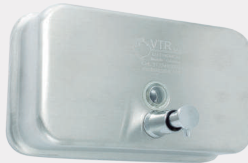
Dispensador de push para jabón líquido en acero inoxidable JAB PUSH 4723 H

Jabonera de push o botón de empuje de pared en acero inoxidable. Sistema de operación por pistón. Descarga por operación: 1 cm 3