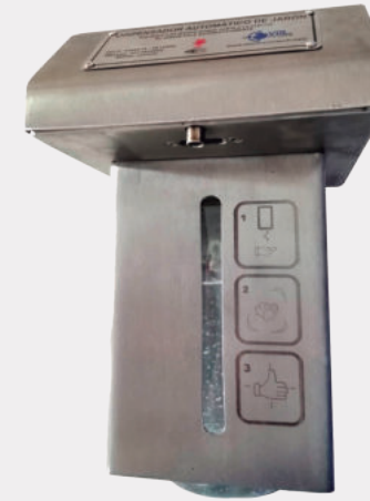
Dispensador de sensor para Jabón líquido Yodado o Antibacterial JAB VTR 1001

Producto sobre pedido. Dispensador en acero inoxidable de jabón líquido activado por sensor. Capacidad: 800 ml. de mesa. Operación: AC 110 voltios. Descarga por operación: 1 ml.