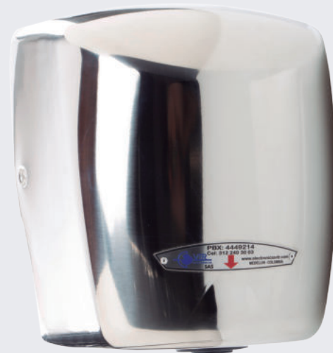
Secador de manos con tiempo de secado Jet / 12 seg.

Secador en acero inoxidable, activado por sensor infrarrojo. Tiempo de secado: 7 seg. – 9 seg. Tipo comercial e institucional, alto tráfico y trabajo pesado. Conexión a 110 voltios. Garantía: 2 años