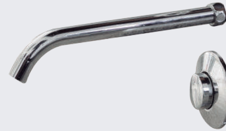
Grifería de push para lavamanos de pared LAV VTR PUSH 4109 EMP

Grifería de accionamiento por push. Cuerpo en bronce duro cromado. Caudal: 1.5 gpm. Presión de funcionamiento: 10 a 125 psi. No depende de la presión de la red de agua de la ciudad.