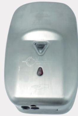
Dispensador de sensor para jabón líquido en acero inoxidable JAB VTR 110

Producto sobre pedido. Dispensador en acero inoxidable de jabón líquido activado por sensor. De pared. Operación: DC. 4 baterías alcalinas AA. Descarga por operación: 1 ml.