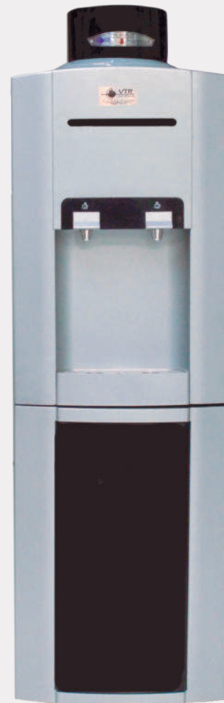
Dispensador de agua con sistema de autollenado VTR 007A

Dispensador de agua fría y caliente de acción automática para beber con sistema de auto llenado. Creado para mejorar la calidad de vida de sus usuarios, previniendo enfermedades por contacto físico ( Covid 19), evitando la contaminación del agua o recipientes por manipulación Color: plata y negro. Conexión: 110 voltios y a fuente de alimentación de agua. Filtro de carbón activado y celulosa incluido.