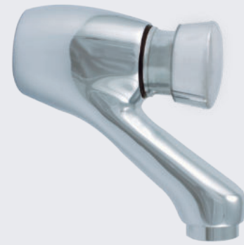
Grifería de push para lavamanos de pared LAV VTR PUSH 4103

Grifería de accionamiento por push. Cuerpo en bronce duro cromado. Caudal: 1.5 gpm. Presión de funcionamiento: 10 a 125 psi. No depende de la presión de la red de agua de la ciudad.