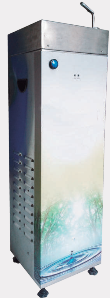
Dispensador de agua fría tipo fuente o punto fijo para beber del grifo VTR 009F

Dispensador de agua fría y caliente para beber con sistema de botellón y compartimento de refrigeración inferior. Color: plata y negro. Conexión: 110 voltios Filtro de carbón activado y celulosa incluido.