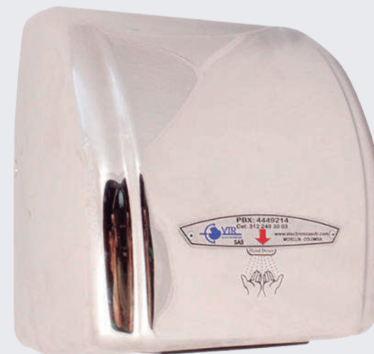
Secador de manos con tiempo de secado normal / 18 seg.

Secador en acero inoxidable, activado por sensor infrarrojo. Tiempo de secado: 10 seg. – 12 seg. Tipo comercial e institucional, alto tráfico y trabajo pesado. Conexión a 110 voltios. Garantía: 2 años