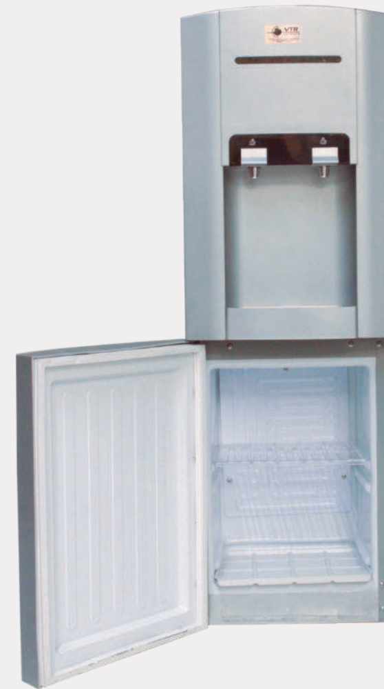
Dispensador de agua para botellón con refrigeración inferior VTR 007B

¡No gaste más dinero en botellones! Dispensador de agua fría y caliente para beber con sistema de auto llenado y compartimento de refrigeración inferior. Dispensador conectado directamente a la red de agua. Color: plata y negro. Conexión: 110 voltios y a fuente de alimentación de agua. Filtro de carbón activado y celulosa incluido.