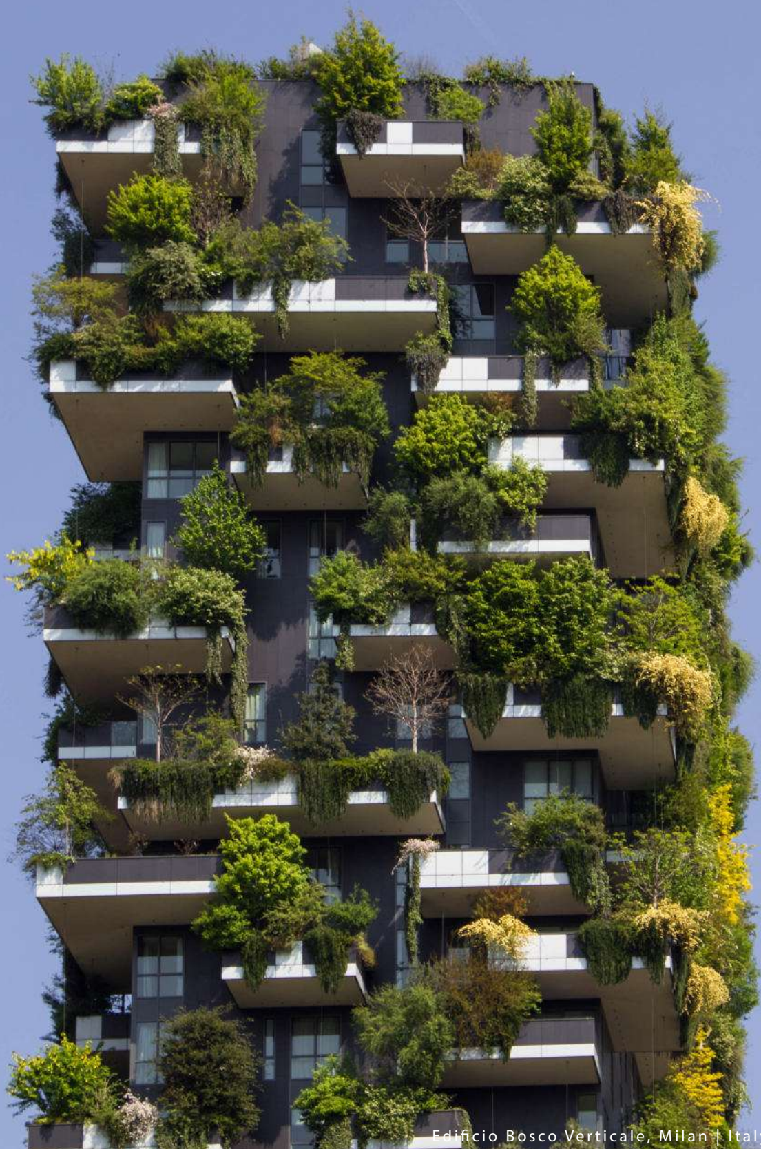
Edificio Bosco Verticale, Milan | Italy.

Amamos lo que hacemos y se nota en nuestros productos. Trabajamos para que la sostenibilidad sea nuestra esencia en todo lo que producimos en nuestro camino hacia la innovación , nuestra forma de trabajar e impactar.