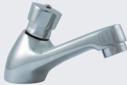
Grifería de push para lavamanos de mesa LAV VTR PUSH 4101

Grifería de accionamiento por push. Cuerpo en bronce duro cromado. Caudal: 1.5 gpm. Presión de funcionamiento: 10 a 125 psi. No depende de la presión de la red de agua de la ciudad.