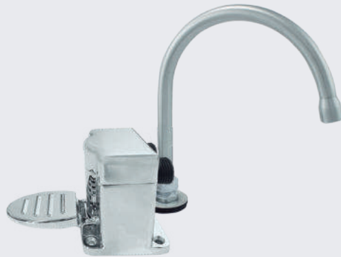
Grifería mecánica de pedal de pie para lavamanos LAV PEDAL VTR 3445

Compuesto por válvula de pedal de pie en aluminio fundido. Grifo cuello de ganso metálico en cromo duro o acero inoxidable. Tubería conexión de 1/2 pulgada y flexo manguera de 3/8.