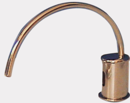
Dispensador de sensor para jabón líquido en acero inoxidable JAB VTR 3345

Producto sobre pedido. Dispensador en acero inoxidable de jabón líquido activado por sensor. De pared. Operación: DC. 4 baterías alcalinas AA. Descarga por operación: 1 ml.