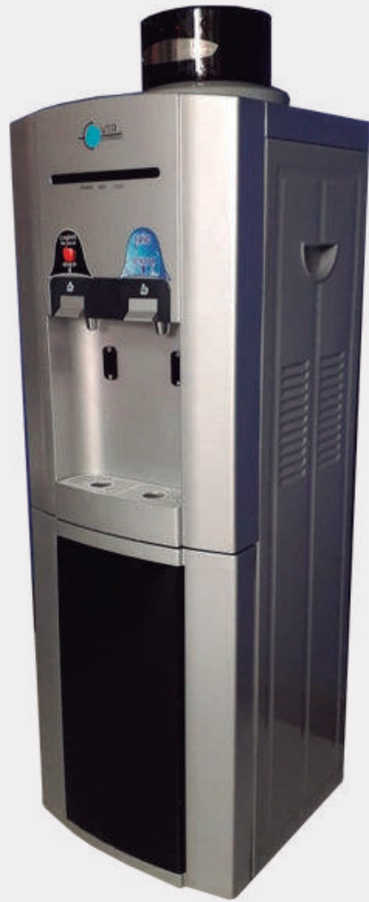
Dispensador de Agua con Sensor y Sistema de Autollenado o Botellón VTR 008S

Dispensador de agua fría y caliente de acción automática para beber con sistema de auto llenado. Creado para mejorar la calidad de vida de sus usuarios, previniendo enfermedades por contacto físico ( Covid 19), evitando la contaminación del agua o recipientes por manipulación Color: plata y negro. Conexión: 110 voltios y a fuente de alimentación de agua. Filtro de carbón activado y celulosa incluido.