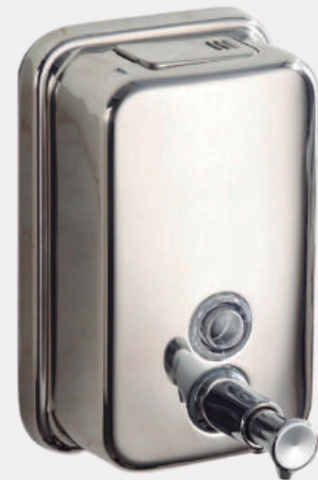
Dispensador de push para jabón líquido en acero inoxidable JAB PUSH VTR 4323V

Jabonera de push o botón de empuje de pared en acero inoxidable. Sistema de operación por pistón. Descarga por operación: 1 cm 3