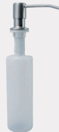
Dispensador de push para jabón líquido en acero inoxidable de mesa JAB PUSH 4725

Jabonera de push o botón de empuje de pared en acero inoxidable. Sistema de operación por pistón. Descarga por operación: 1 cm 3