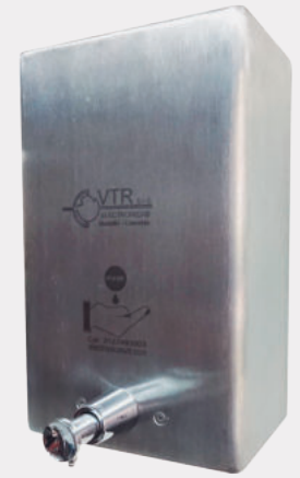
Dispensador de sensor para Jabón líquido de pared JAB VTR 8723

Producto sobre pedido. Dispensador en acero inoxidable de jabón líquido activado por sensor. Capacidad: 1 Litro. De pared. Operación: AC 110 voltios. Descarga por operación: 1 ml.